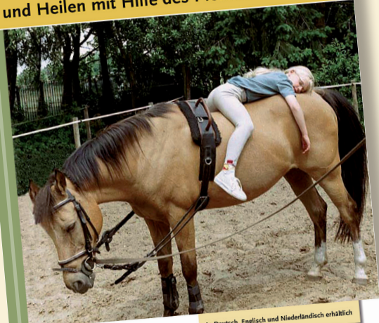
In Deutsch, Englisch und Niederländisch erhältlich

Entwickeln, Fördern, Unterstützen und Heilen mit Hilfe des Pferdes