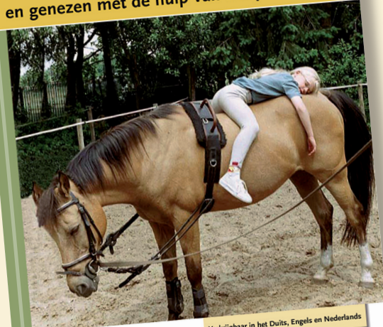
Verkrijgbaar in het Duits, Engels en Nederlands